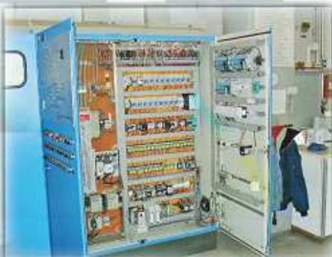
Moeller-Steuerung zur Abfallverbrennung