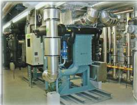
Thermax Absorber, DBI Schönbühl