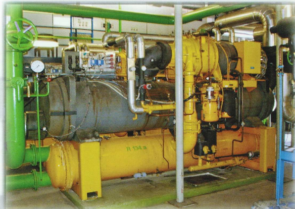
Turboverdichter, Migros Aare