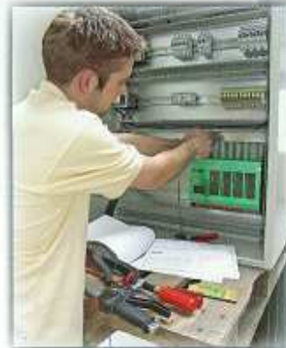
Einbau einer Sauter-Steuerung