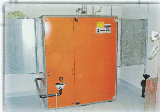
Luft-, Wasser-, Wärmepumpe, MFH Emmen